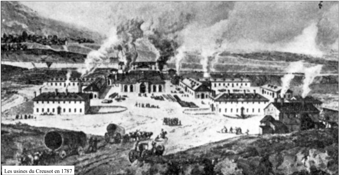
Les usines du Creusot en 1787