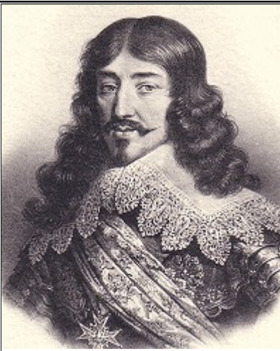
Louis XIII : roi de 1610 (à 9 ans) à 1643

Louis XIII devient roi à 9 ans et sa mère gouverne pour lui. Mais à force de maladroites, les grands seigneurs n'obéissent plus et les protestants commencent à se révolter. En 1617 Louis XIII reprend le pouvoir et tente de s'imposer mais il lui faudra attendre 1624 pour trouver le cardinal de Richelieu qui saura imposer la volonté du roi.