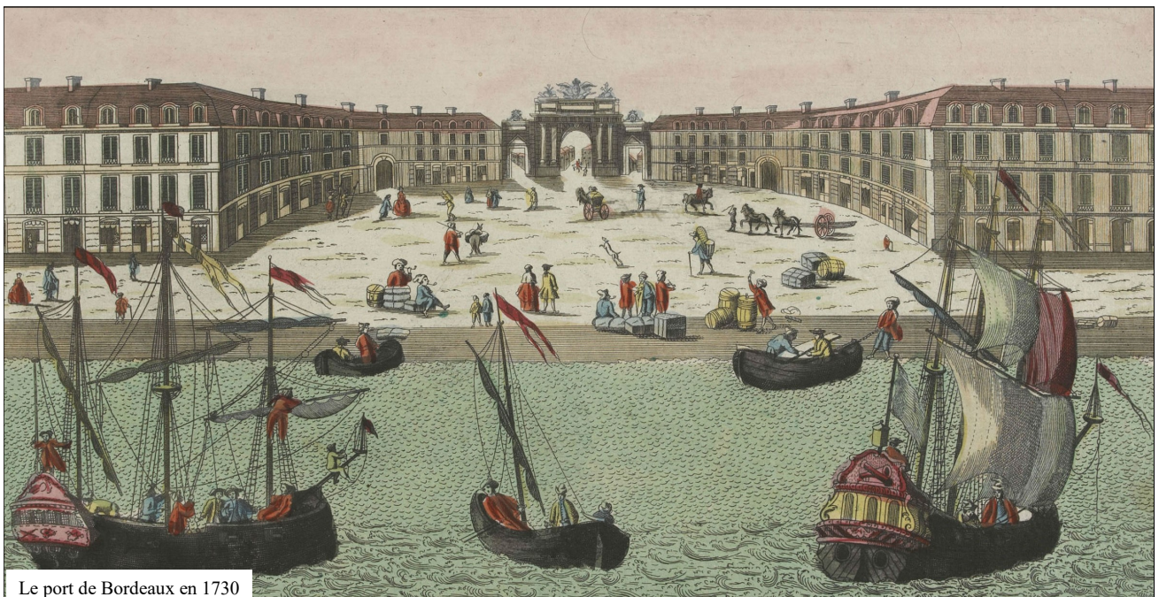
Le port de Bordeaux en 1730