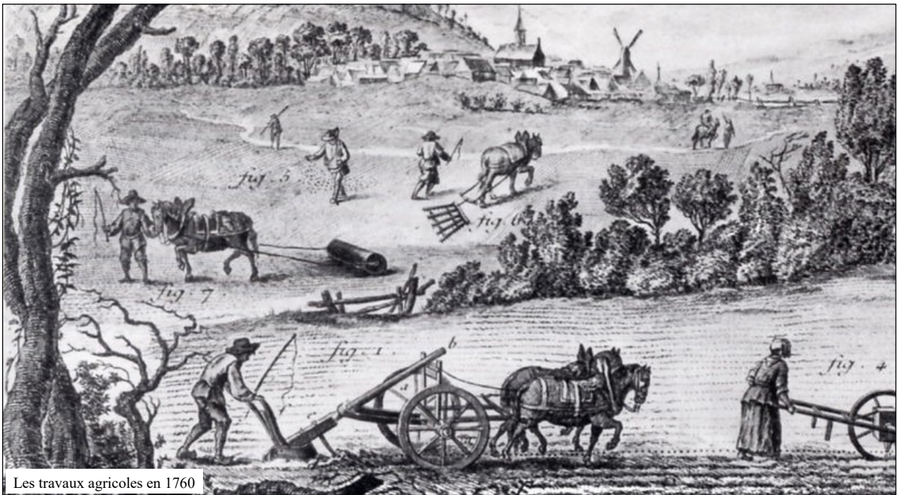
Les travaux agricoles en 1760