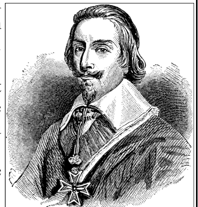
Richelieu : premier ministre (1624-1642)

Avant de mourir, Richelieu désigne comme successeur le cardinal Mazarin qui saura protéger le jeune roi Louis XIV (5 ans en 1643) contre la Fronde.